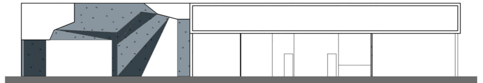
Sezione longitudinale A-A