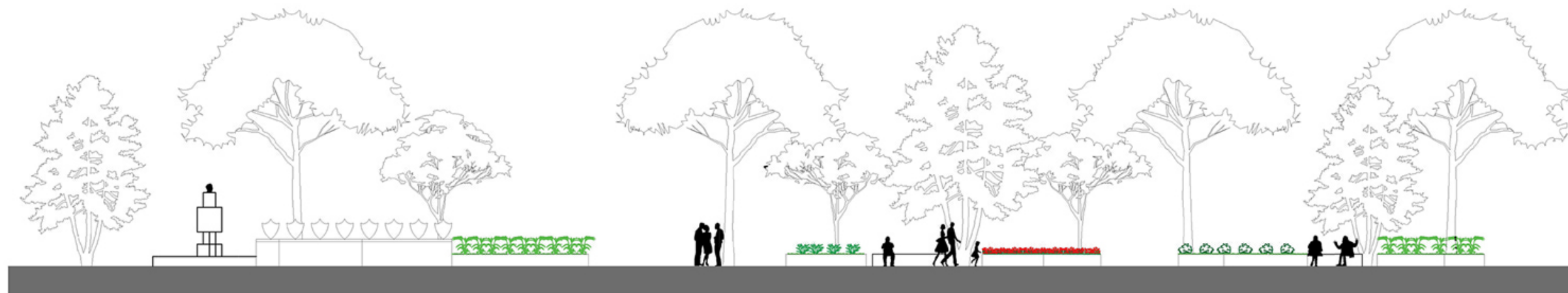
Profilo longitudinale Parco dei Popoli e Viale Aldo Moro scala 1:200